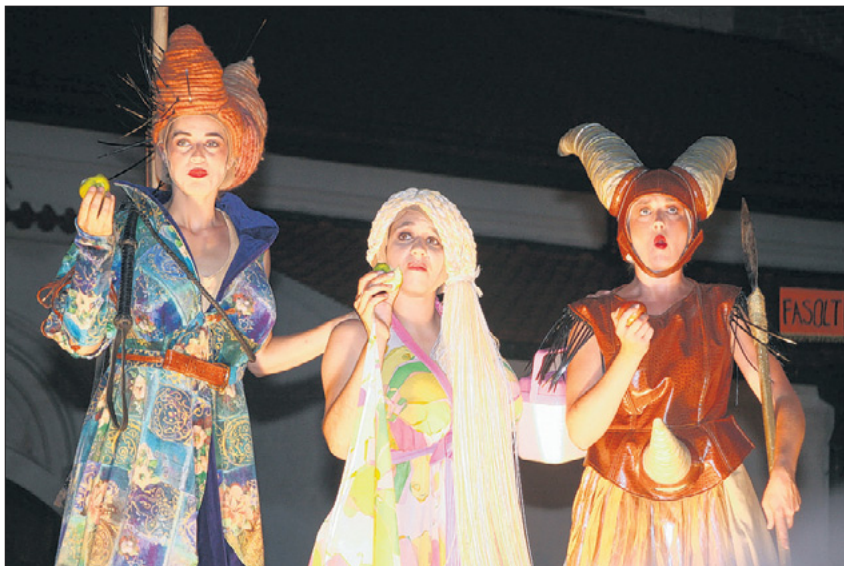
Mit dem Apfel verführte schon Eva im Paradies