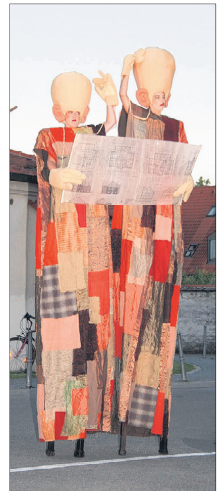
Die Riesen hatten einen Plan