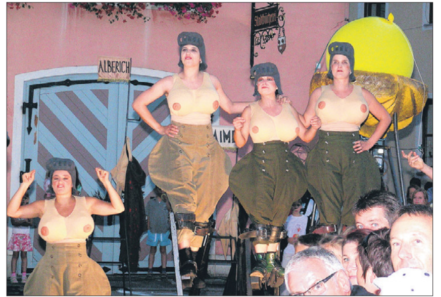
Wotan besitzt endlich die Macht mit dem Ring