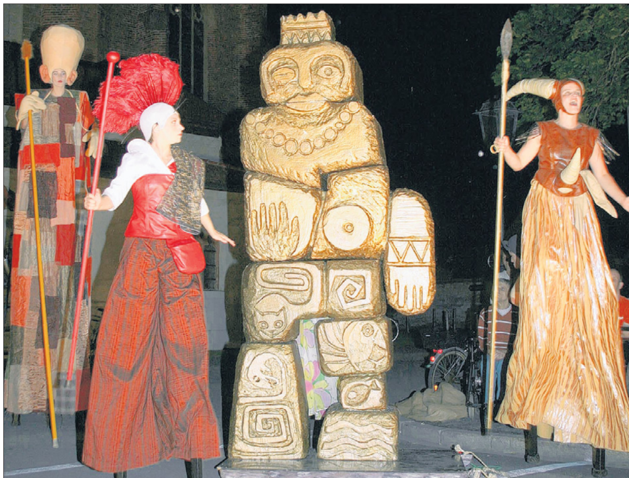
Am Ende der Vorführung entstand eine Statue aus reinem Gold