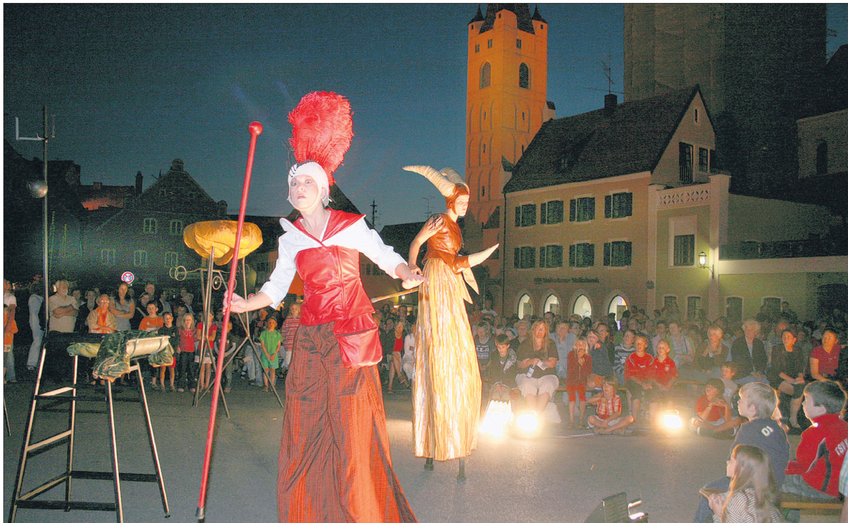
Der listige Loge, ein Wanderer zwischen den Welten, berichtete vom Raub des Goldes

Erstmals gewinnt eine Team-Elf den Sparkassen-Cup